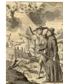
Pierre Favre (1506-1546)