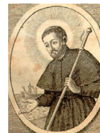
Francisco Javier (1506-1552)