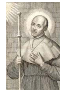
Ignacio de Loyola (1491-1556)