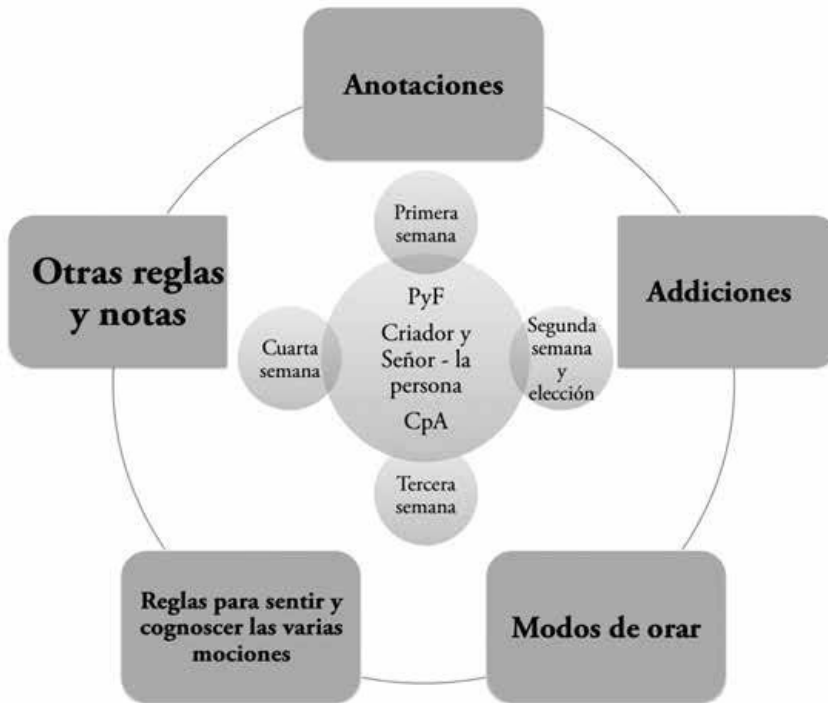
Fig.1. Visión general del proceso de Ejercicios

En primer lugar, el círculo hermenéutico y/o metodológico introduce las ayudas prestadas al «hombre discernidor» en su proceso de objetivación de la experiencia espiritual 14 en un modo y orden concretos. Así, este satélite de actividades (modos de orar, reglas, adiciones o disposiciones para los diferentes tiempos de ejercicios, notas) propician la unción del Espíritu Santo quien enseña, acompaña e ilustra 15 según tiempos, lugares y personas; «el Espíritu Santo, el defensor que el Padre