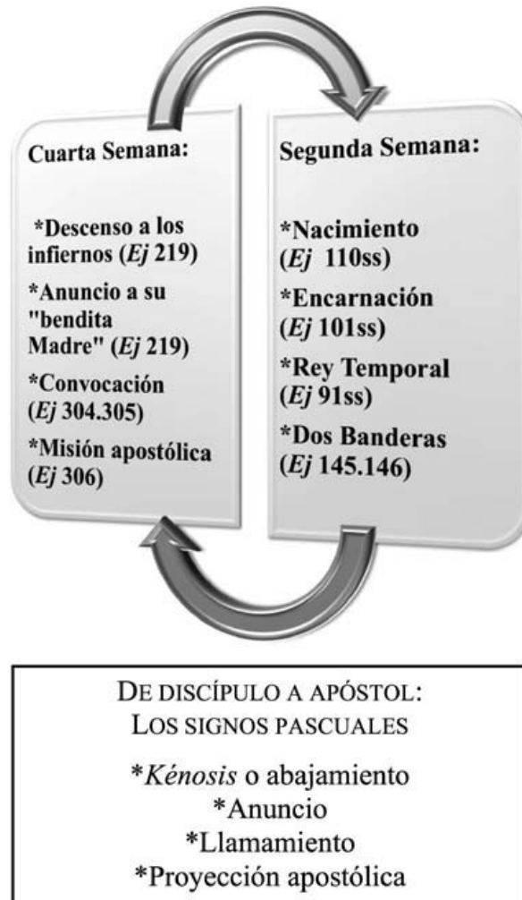
Fig.5. Esquema de Cuarta Semana y Segunda Semana

ejercitante y lo proyecta hacia una transición determinante: el paso de ser discípulo a ser apóstol.